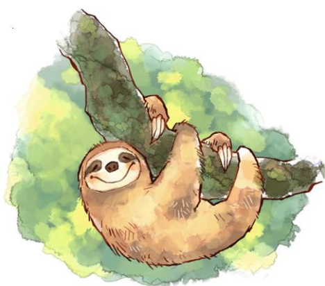
Baan Brekend Werk

De gemeente is sinds de invoering van de nieuwe Wet Maatschappelijke Opvang (WMO) verantwoordelijk voor de opvang en begeleiding van alle kwetsbare burgers, dus ook van ggz cliënten. De cliëntenraad heeft contact met diverse wmo-adviesraden in de regio om ook daar de belangen van ggz cliënten op de agenda te houden.